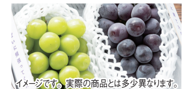
イメージです。実際の商品とは多少異なります。

5,500円(一般価格 6,500円送料込 ※県外発送は追加料金有) お盆明け~8月末発送予定 ぶどうの収穫に最も良い時間帯は、香りや甘み成分が一番充実している夜明け前。 朝採れのぶどうを白系(シャインマスカット)と黒系の食べくらベセットにして農園直送でお届けします! 内 容 量 1kg箱(約500g×2品種)