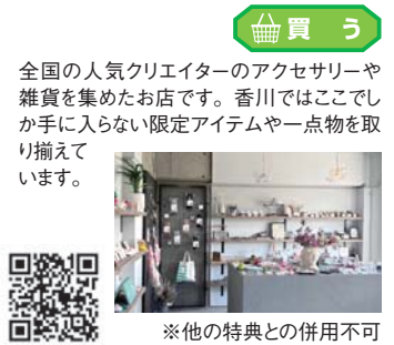
※他の特典との併用不可