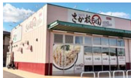
※他の特典との併用不可

セルフリうどんと言えば、さか枝と言われる老舗うどん店。釜揚げうどんをかけ出汁で食す釜かけと、釜バター明太うどんも絶品です。