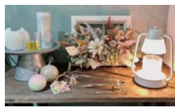
※他の特典との併用不可

キャンドルの販売のほか、製作体験・オーダー製作なども行っています。情報はインスタグラムにて随時更新中。