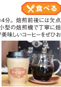
※他の特典との併用不可