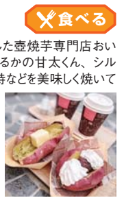
※他の特典との併用不可