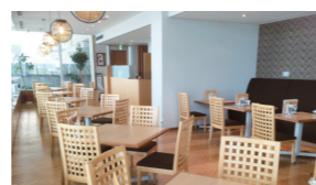
※他の特典との併用不可

高松市玉藻町5-5 香川県立ミュージアム1F ☎087-822-9722 ⌚9:00~17:00(LO16:30) 休 月曜日 (香川県立ミュージアム休館日に準ずる) 会 会員及び同伴者 会員証提示