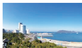
※他の特典との併用不可

高松市玉藻町9-10 香川県民ホール6F ☎087-823-2636 ⌚11:30~18:30(LO18:00) ※ホール催事が無い場合15:00まで 休 不定休(県民ホール休館日に準ずる) 会 会員及び同伴者 会員証提示