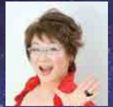
総合プロデュース/るいまま