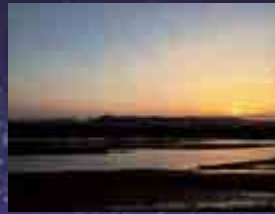
空間ラウンジから見た風景

当日はテルサレストラン 17時~特別OPEN! 「銀河飛行特別メニュー」 あります!