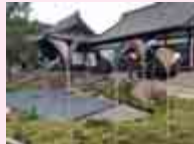
洲崎寺にてイメージ写真