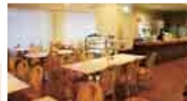
※他の特典との併用不可