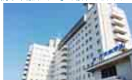
※他の特典との併用不可

Ⓜ 会員様と同伴者計2名まで 会員証提示 ※予約の際に「ウエルばる高松」会員である旨をお伝えください。