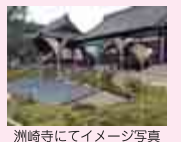
洲崎寺にてイメージ写真