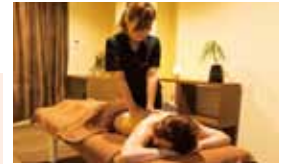
※他の特典との併用不可

高松三越前にオープンした「Healing CAY」。リンパ整体、アロマオイルトリートメント、酵素カプセルと様々なご要望に対応いたします。他のサロンと一味違う時間を提供いたします!