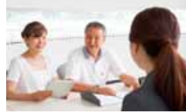
※他の特典との併用不可

家事・育児・家族介護のお手伝いをします。有資格者のヘルパーがご自宅にお伺いします。フリーダイヤルにお電話ください。