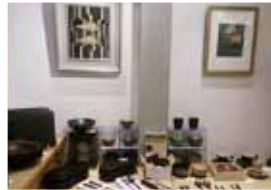
※他の特典との併用不可

漆芸のすばらしさを伝えようと設立した美術館です。漆芸商品を数多く展示しています。