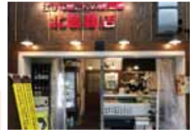
※他の特典との併用不可

おさかなさんが始めた居酒屋です。魚の鮮度には自信があります!お近くに来られた際にはぜひお立ち寄りください。