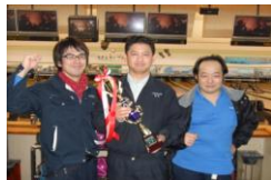
団体優勝 ナベプロセス 様