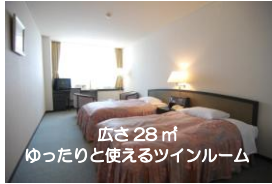
広さ28㎡ ゆったりと使えるツインルーム