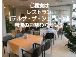
ご食事はレストラン『テルサ・ザ・シアトル』自慢の日替わりランチ