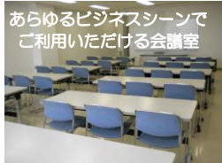
あらゆるビジネスシーンでご利用いただける会議室