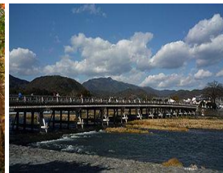
嵐山のシンボル渡月橋の景色、 ショッピングをお楽しみくだ さい。