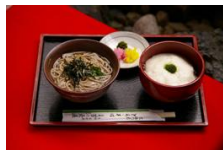
昼食は「苔乃茶屋」 とろろ麦ごはんセット