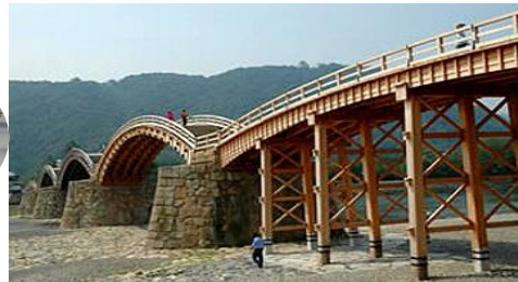
日本三大名橋 錦帯橋