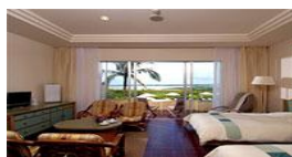
軽井沢倶楽部ホテル石垣島

※ 行程は一部変更になる場合がございます。 ☆ 宿泊は、洋室ツインルーム(2人1室)です。