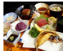
ゆうな御膳 石垣島の伝統家庭料理

※ 行程は一部変更になる場合がございます。 ☆ 宿泊は、洋室ツインルーム(2人1室)です。